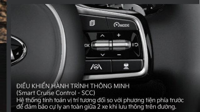
ĐIỀU KHIỂN HÀNH TRÌNH THÔNG MINH (Smart Cruise Control - SCC) Hệ thống tính toán vị trí tương đối so với phương tiện phía trước để đảm bảo cự ly an toàn giữa 2 xe khi lưu thông trên đường.

Kia Sorento được trang bị hệ thống an toàn chủ động thông minh vượt trội, mang lại sự an tâm và tin tưởng cho người dùng