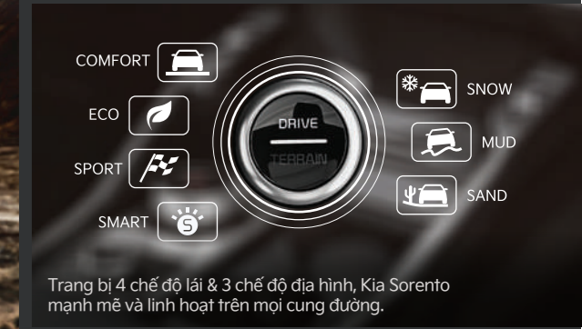
Trang bị 4 chế độ lái & 3 chế độ địa hình, Kia Sorento mạnh mẽ và linh hoạt trên mọi cung đường.