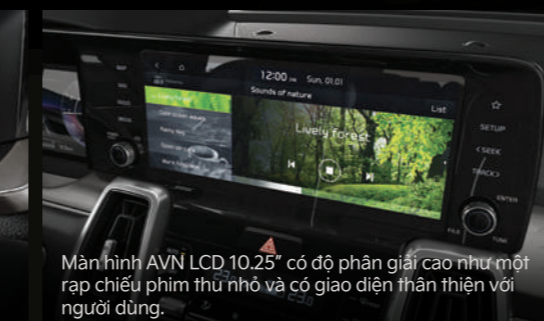
Màn hình AVN LCD 10.25" có độ phân giải cao như một rạp chiếu phim thu nhỏ và có giao diện thân thiện với người dùng.