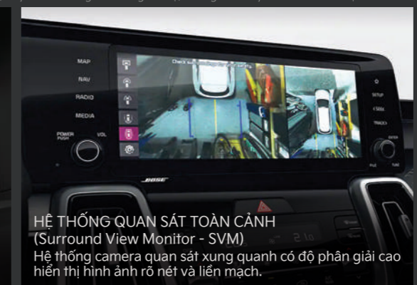
HỆ THỐNG QUAN SÁT TOÀN CẢNH (Surround View Monitor - SVM) Hệ thống camera quan sát xung quanh có độ phân giải cao hiển thị hình ảnh rõ nét và liền mạch.