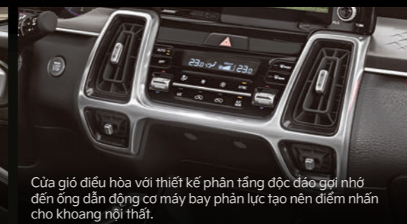
Cửa gió điều hòa với thiết kế phân tầng độc đáo gợi nhớ đến ống dẫn động cơ máy bay phân lực tạo nên điểm nhấn cho khoang nội thất.