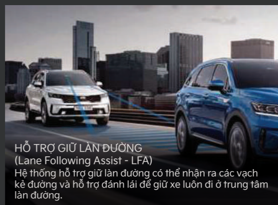
HỖ TRỢ GIỮ LÀN ĐƯỜNG (Lane Following Assist - LFA) Hệ thống hỗ trợ giữ làn đường có thể nhận ra các vạch kẻ đường và hỗ trợ đánh lái để giữ xe luôn đi ở trung tâm làn đường.