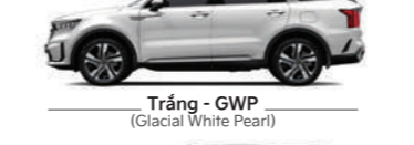
Trắng - GWP (Glacial White Pearl)