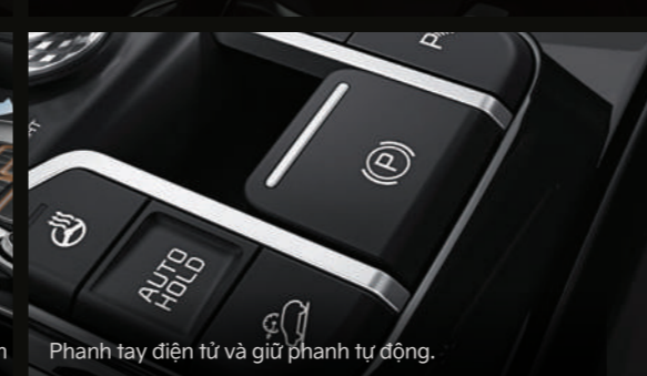
Phanh tay điện tử và giữ phanh tự động.