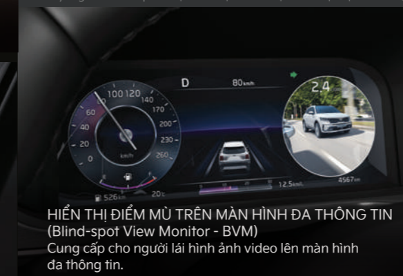
HIỂN THỊ ĐIỂM MŨ TRÊN MÀN HÌNH ĐA THÔNG TIN (Blind-spot View Monitor - BSVM) Cung cấp cho người lái hình ảnh video lên màn hình đa thông tin.

Lưu ý: Người lái luôn phải chịu toàn bộ trách nhiệm cho việc vận hành xe, đây chỉ là những tính năng hỗ trợ, không thể thay thế hoàn toàn việc lái xe.