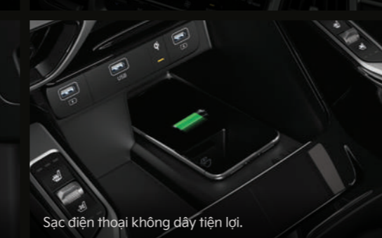
Sạc điện thoại không dây tiện lợi.