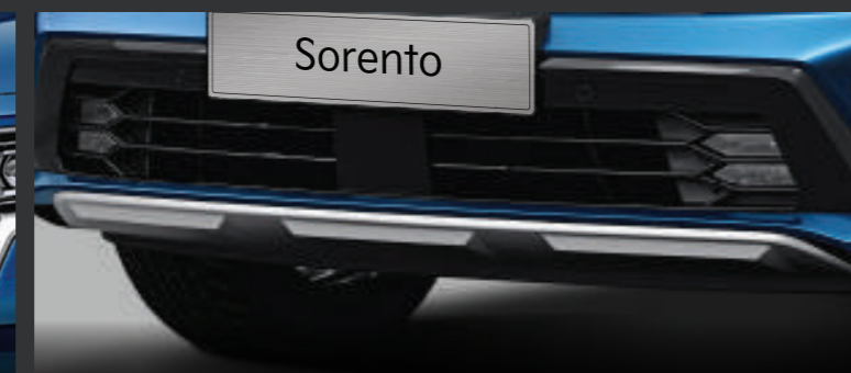
CẢN TRƯỚC Hốc gió kết hợp với thiết kế lưới tản nhiệt tạo nên dáng vẻ thể thao và công nghệ.