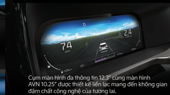
Cụm màn hình đa thông tin 12.3" cùng màn hình AVN 10.25" được thiết kế liền lạc mang đến không gian đậm chất công nghệ của tương lai.

Nội thất Kia Sorento được thiết kế rộng rãi, tinh tế, sang trọng và hiện đại với nhiều trang bị tiện ích cao cấp