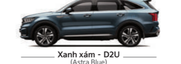
Xanh xám - D2U (Astra Blue)