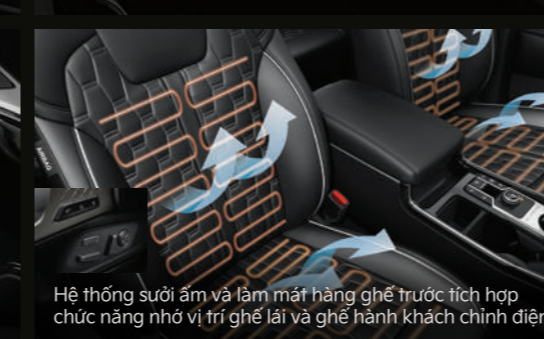
Hệ thống sưởi ấm và làm mát hàng ghế trước tích hợp chức năng nhớ vị trí ghế lái và ghế hành khách chính diện