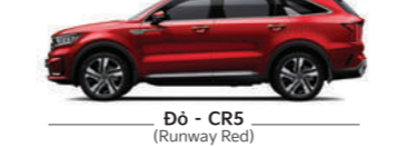
Đỏ - CR5 (Runway Red)