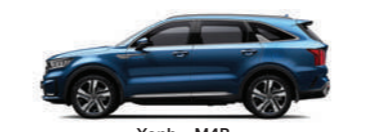
Xanh - M4B (Mineral Blue)