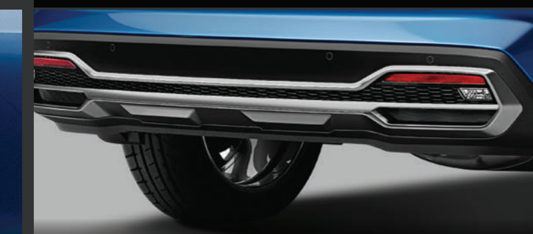
CẢN SAU Được thiết kế hiện đại và năng động với bộ đèn bảo vệ và phản quang.