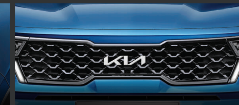
LƯỚI TẢN NHIỆT Nhấn mạnh từng chi tiết, tạo chiều sâu bằng cách áp dụng thiết kế hai tầng và cấu trúc dạng khối.