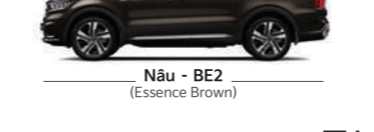
Nâu - BE2 (Essence Brown)

☎ 1900 545 591 🌐 kiavietnam.com.vn 📘 facebook.com/KiaVietNam.Official