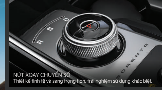
NÚT XOAY CHUYỂN SỐ Thiết kế tinh tế và sang trọng hơn, trải nghiệm sử dụng khác biệt.