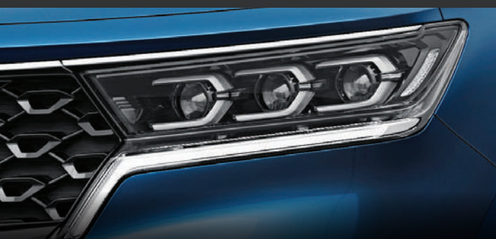
CỤM ĐÈN TRƯỚC LED Đèn chạy ban ngày (DRL) và dãy đèn pha LED thiết kế độc đáo và hiện đại.