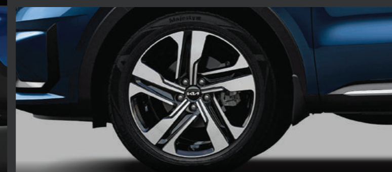
MẪM XE Kích thước 19-inch.