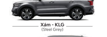
Xám - KLG (Steel Grey)