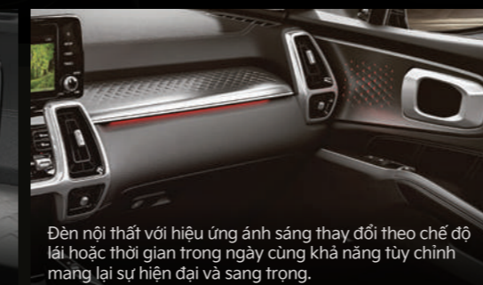
Đèn nội thất với hiệu ứng ánh sáng thay đổi theo chế độ lái hoặc thời gian trong ngày cũng khả năng tùy chỉnh mang lại sự hiện đại và sang trọng.