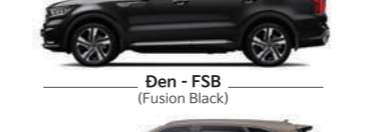
Đen - FSB (Fusion Black)