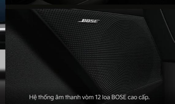
Hệ thống âm thanh vòm 12 loa BOSE cao cấp.