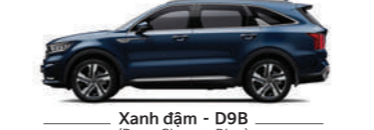
Xanh đậm - D9B (Deep Chroma Blue)