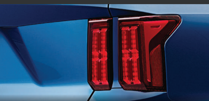
ĐÈN BẢO RỆ/ĐÈN PHANH Thiết kế độc đáo, tách biệt theo phương thẳng đứng là đặc trưng ở mẫu xe SUV cỡ trung - lớn của thương hiệu Kia.