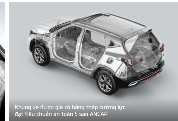
Khung xe được gia công bằng thép cường lực đạt tiêu chuẩn an toàn 5 sao ANCAP