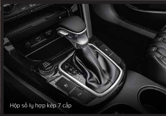
Hộp số ly hợp kép 7 cấp

NORMAL Cân bằng giữa công suất và tiết kiệm nhiên liệu