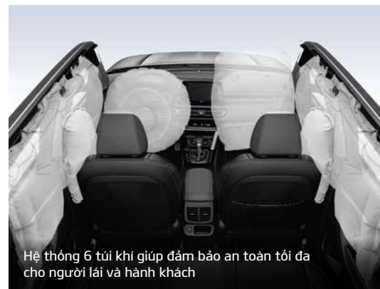
Hệ thống 6 túi khí giúp đảm bảo an toàn tối đa cho người lái và hành khách