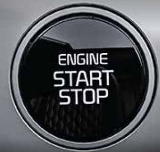
Nút khởi động Start/Stop

Vận hành linh hoạt trên nhiều loại địa hình và tiết kiệm nhiên liệu